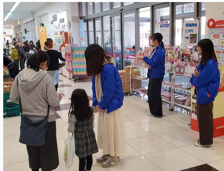
アンケート調査の様子