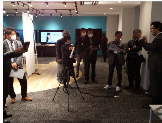
ドコモ5GオープンラボFUKUOKA