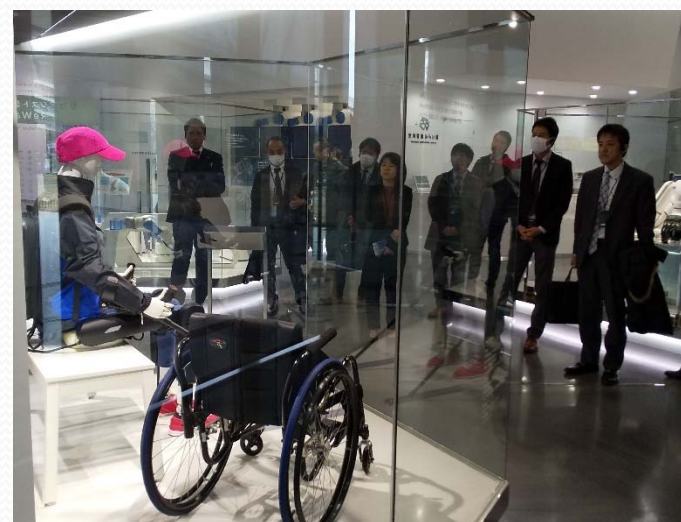
安川電機ロボット村